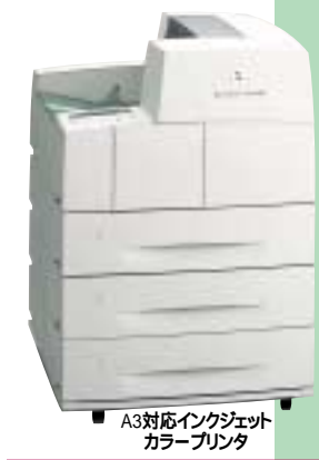
ワークセンター WorkCentre B900/B900N (B900Nはネットワーク標準モデル)