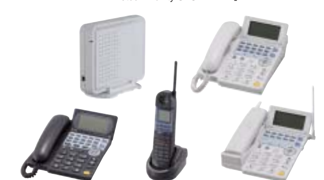
NTT東西 「Netcommunity SYSTEM BX」