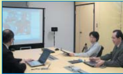
幹部社員の会議風景。テレビ会議システムで、グループ会社の担当者とのミーティング。資料はタブレットPCまたはノートパソコンで参照する。

NJC ネットコミュニケーションズ株式会社 http://www.netcoms.ne.jp/