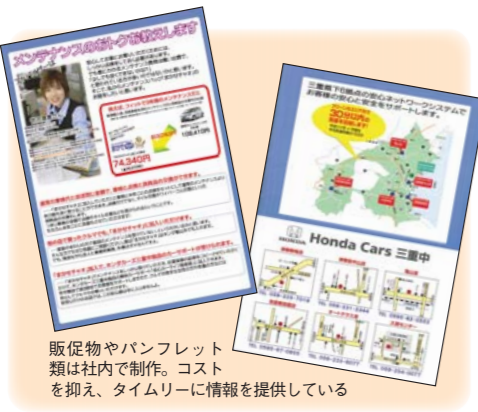
販促物やパンフレット類は社内で作成。コストを抑え、タイムリーに情報を提供している