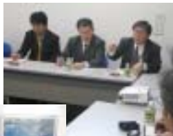
今回は仙台で開催された

探すこと。徳島県情報産業協会と10社の企業が出席。「良い商材があった」「これからは開発だけでなく売り方を研究せねば」など、ビジネスの前進を予感させる感想が出された。両局では今後もうこうした場の提供を続けていきたいとしている。