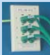
フェイスプレート