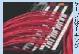
ケーブルマージング